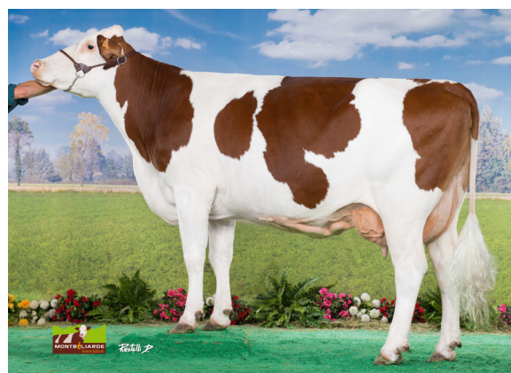
FISTULINE • GAEC DE LA RANDOUILLÈRE (53) EN REMONTANT L'ARBRE GÉNÉALOGIQUE DE PESTO JB SE TROUVE URSULINE (MICMAC), MÈRE DE FISTULINE (URBANISTE), GRANDE CHAMPIONNE AU SPACE EN 2015

Afin de répondre à vos attentes, l'offre sexée se renouvelle de plus en plus fréquemment. Rendez-vous à la prochaine indexation, le 15 juin, pour découvrir de nouveaux taureaux.