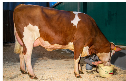
Obole (Jiteuf JB/Devil JB) GAEC Bragard Ecartot • Barretaine 1 re lactation Meilleur contrôle 27,6 kg