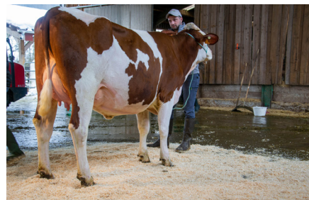
Othello (Maximo JB/Micmac) EARL RG Elevage • La Chaumusse 1 re lactation • Meilleur contrôle 27,2 kg Âge du 1 er vêlage : 30 mois