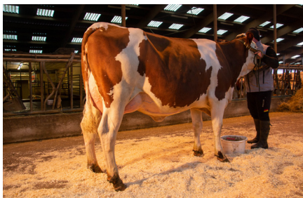
Odyssey (Jiteuf JB/ADN JB) GAEC des Grenouilles • St Hymetière 1 re lactation • Meilleur contrôle 26,5 kg Âge du 1 er vêlage : 29 mois