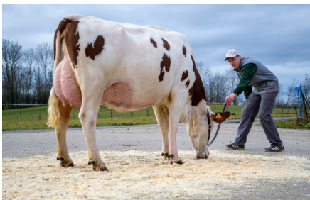
Judicieuse (Holding JB/Soja JB) GAEC du Saugie Gillois