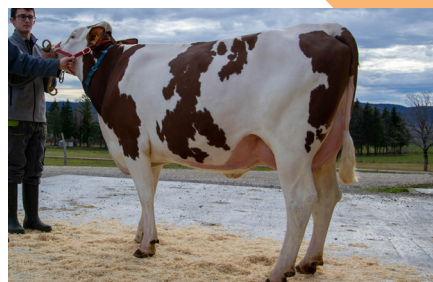
Ogloria (Maximo JB/Valfin JB) GAEC Sainte-Claire • Essavilly 1 re lactation • Meilleur contrôle 28,3 kg Âge du 1 er vêlage : 28 mois

La descendance de JITEUF JB ( Holding JB/Funky JB ), a elle aussi marqué les esprits. Ce ne sont pas moins de 21 femelles qui ont été filmées dans 21 cheptels de la plaine doloise au Haut-Jura, en passant par les différents plateaux.