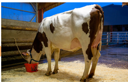
Ofelia (Maximo JB/Gresil JB) GAEC Droz Grey • Pont du Navoy 1 re lactation • Meilleur contrôle 33 kg Âge du 1 er vêlage : 29 mois