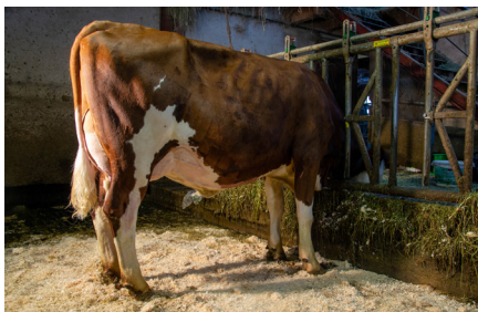
Ounaff (Maximo JB/Bogoro JB) GAEC Gérard Bailly et fils • Uxelles 1 re lactation • Meilleur contrôle 25,4 kg Âge du 1 er vêlage : 28 mois