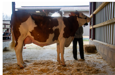
Normande (Funky JB/Hellean JB) GAEC des Puits Montlainsia