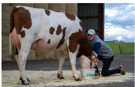
Oceanie (Jiteuf JB/Valfin JB) GAEC des 4 Vents • Vannoz 1 re lactation • Meilleur contrôle 23,5 kg Âge du 1 er vêlage : 29 mois

Elles ont confirmé la morphologie exceptionnelle laissée par JITEUF JB . Ce dernier est né au GAEC Saillard (39) et est issu de la même souche que GLORIA ( Vigor JB ), meilleure mamelle et championne senior au Prestige en 2018 et actuellement en cours de 8 e lactation.