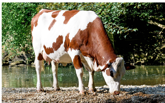
LAÏKA (HARPON JB), MÈRE DE PALMAS JB (MODELO JB) GAEC DU PRIEURÉ (39)

Parmi eux, on retrouve de grands laitiers : PESTO JB ( Nino JB ) (+ 930 kg, +1.8 cel, +0.9 REPRO ; 123 MA), PALMAS JB ( Modelo JB ) (+895 kg, +1.5 cel, 114 MO), des taureaux très améliorateurs en morphologie dont PAVARD JB ( Maximo JB ) (135 MO, 134 MA), OXODE JB ( Mercury JB ) (121 MO, 119 MA), OXIBIS JB ( Mauléon JB ) (120 MO, 121 MA) ; des taureaux au pedigree plus variable avec entre autres PERITEL JB ( Merckx JB ) (+711 LAIT, +0.7 CEL).