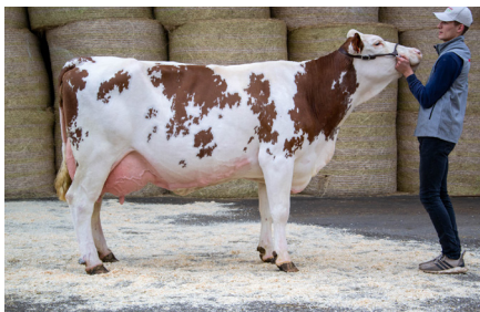
Detresse (Soja JB/Prelude JB) GAEC des 4 Vents Vanno