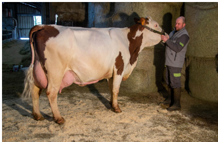
Eaudevie (Soja JB/Pif JB) GAEC Vichot La Chailleuse