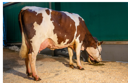
Miss (Esprit JB/Vigor JBI) GAEC Bragard Ecarnot Barretaine