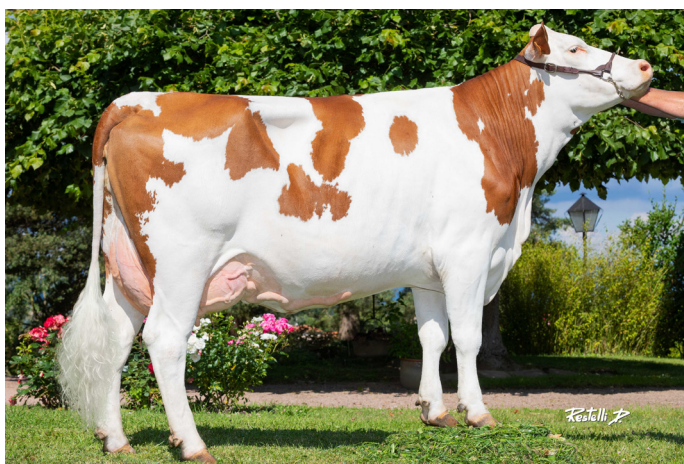
NEBULEUSE, JOMBRIK JB's daughter, PADIRAC JB's dam (GAEC Elevage de Ressay - 42)