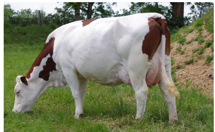
MIMA, Esprit JB's daughter, OBREZAC JB's dam (GAEC PASCAL-MALLET - 15)

With 18 new young sires (where 10 are available as of now and 8 will be in September), this release promises to be exceptional in numbers and genetic quality. The average of the new JB's is 117 in type, 118 in udder. It is also higher than 700 kg of milk and +0.4 in Protein! The functionals are all positive with an average of +0.4 SCC, +0.2 REPRO and +0.7 PL.