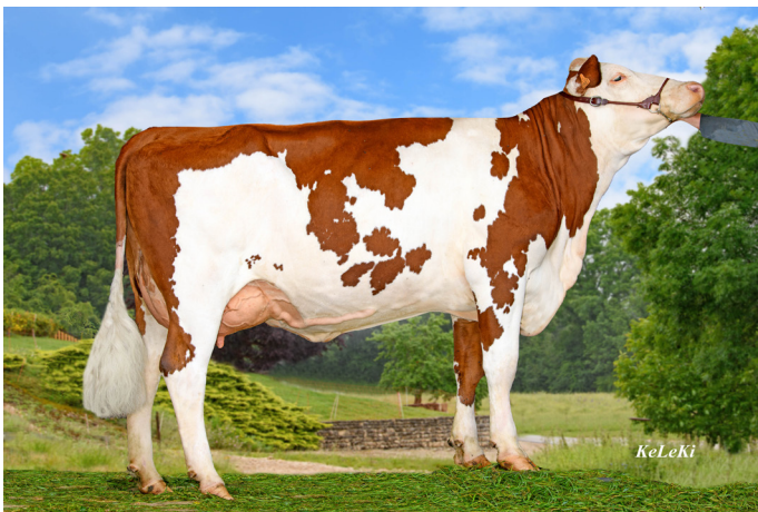
NINJA, LINAO JB's daughter (GAEC Chevassu - 39)

Last spring, 7 bulls arrived in the JB Progeny tested sires category. Among them, LINAO JB was the first son of HARPON JB to integrate progenies (now 65) in his index. With 145 points of ISU, he now stands at the N°1 place in ISU of the JB Progeny tested sires just in front of his father. In addition to milk (+606 kg) and Protein (+1.4), LINAO JB has a positive somatic cell index (+1.9). The muscularity (107) and the general morphology (TY 113 and UD 114) also make him an essential JB Progeny tested sire.