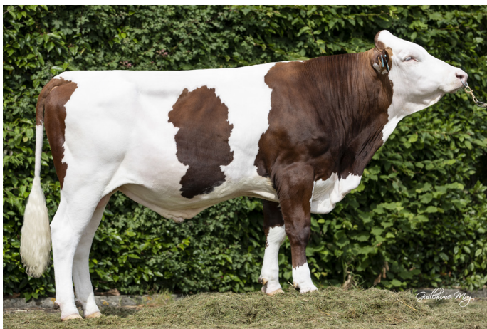
OMIRAIL JB ( Magic JB / Hallez )

With a Type synthesis scored at 137 points, PAVARD JB ( Maximo JB / Horton ) is the N°1 of the breed in this field. Coming from two champion lines, there is no doubt this sire scored at 128 in TY, 116 in RU, 107 in MU and 133 in UD will seduce you.