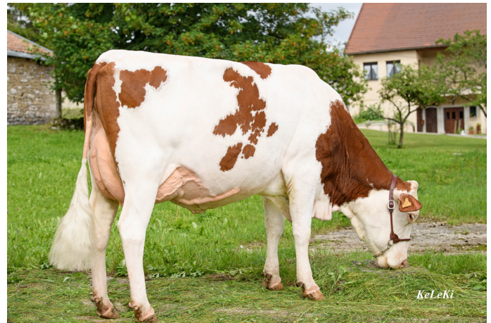
1873, JITEUF JB's daughter (GAEC Saint-Anne - 39)

All the JB Progeny tested sires are ranked in the summary table (page 4-5 of this EVA MAG) but how can we not talk about JITEUF JB ( Holding JB / Funky JB ), n°2 within the breed in Type for progeny tested bulls : TY 130, BO 127, FL 113 and UD 121. With 48 daughters scored, he confirms the expectations placed on him from the beginning with his genomic proofs.