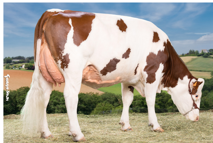
MACOMBA, Horton's daughter, PAVARD JB's dam (GAEC Blondet - 39)

Bulls combining milk production and type are available in JB Sexed Sires and JB Genomic Sires: