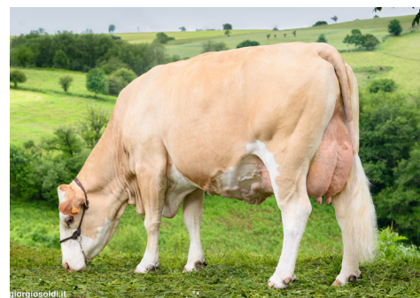
Ophélie, mère de TANGO

Tarif compris dans l'IA IPE nous contacter