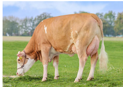
Florence, mère de GS MACH MIT P