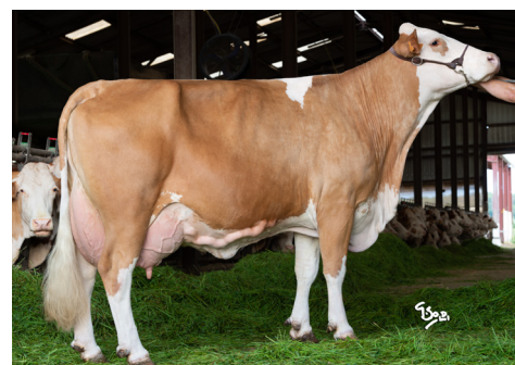
Inédite, Mère de TENOR