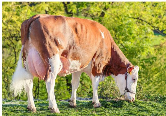
Mère de GS WUNDAKIND