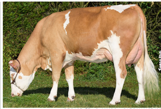
PEGASE, fille de NIKOS • GAEC HANCE (88)