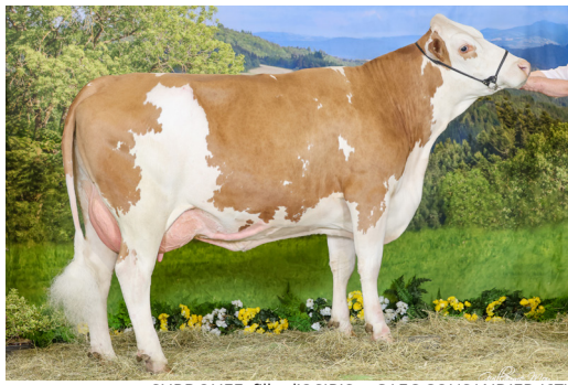
SURDOUEE, fille d'OSIRIS • GAEC COUSANDIER (67)