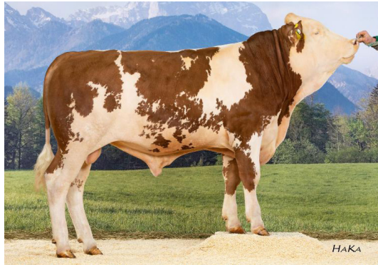
GS WHY NOT