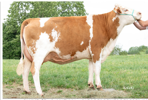
PLUME, fille de MATUVU • GAEC DES REINES DES PRES (39)