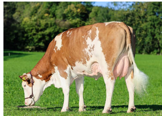
Mère de GS MAGIC BOY