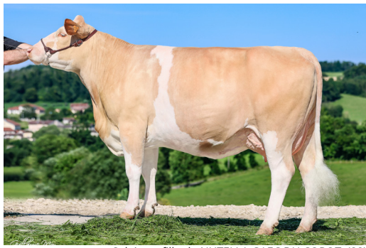
Salaison, fille de NUTELLA GAEC DU COROT (88)