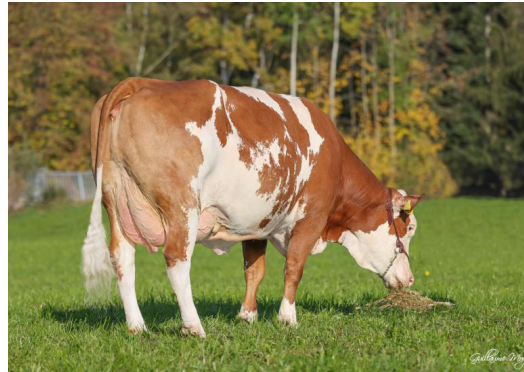
Famelin, Mère de GS WHY NOT