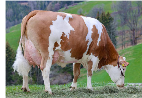
Mère de GS SUPPORT