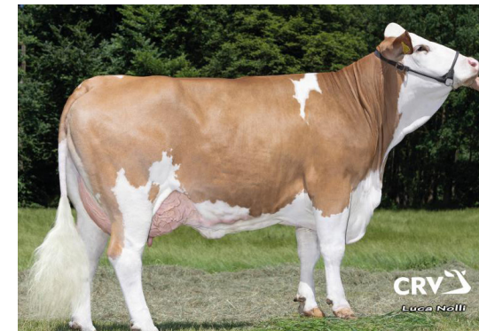
Mère de MODENA P