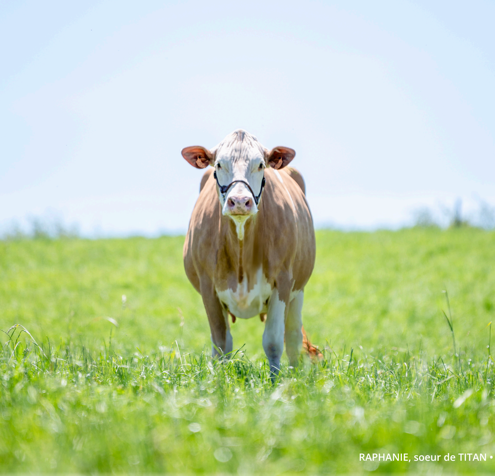
RAPHANIE, soeur de TITAN •